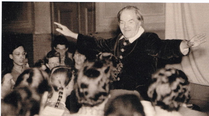
ASW Winnenden 1954.